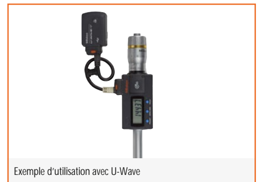
Exemple d'utilisation avec U-Wave