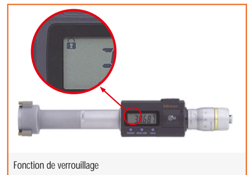
Fonction de verrouillage